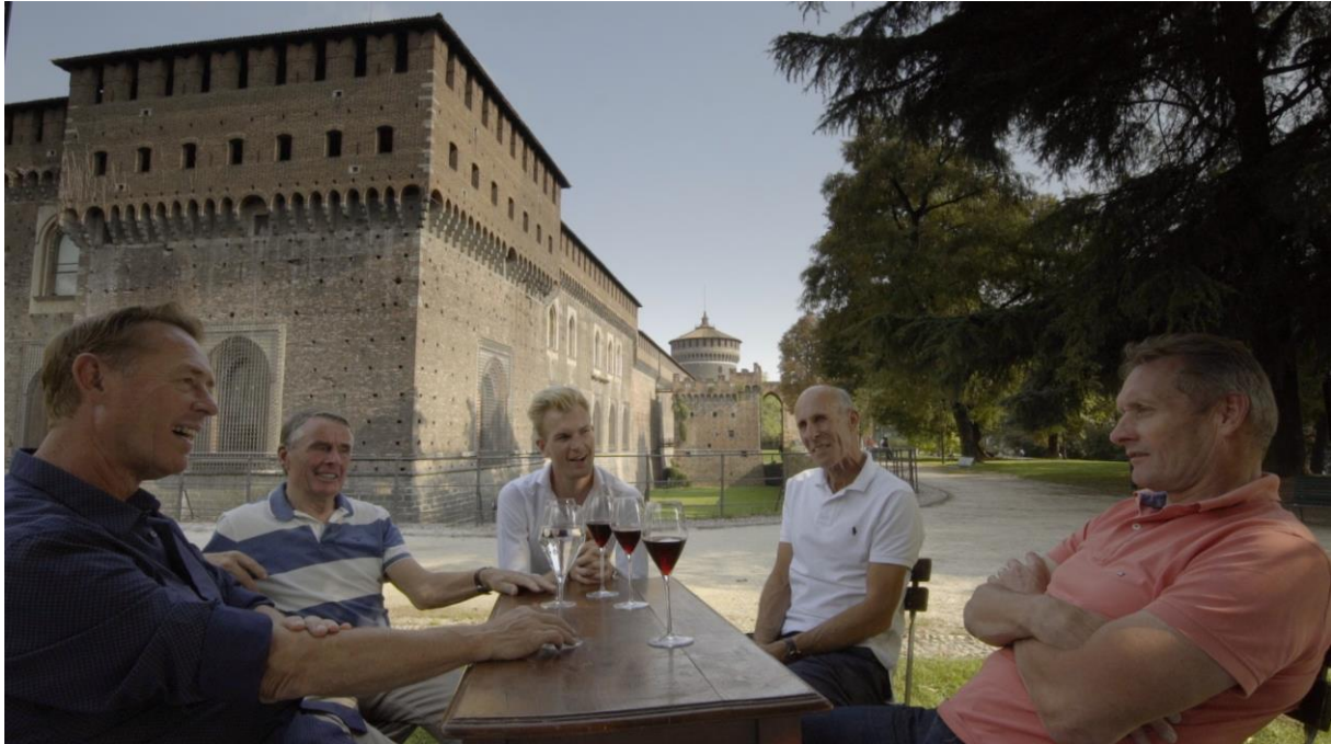
Eric Vanderaerden, Hennie Kuiper, Ruben Van Gucht, Ludo Peeters, Adrie van der Poel

De aftrap van het klassieke voorjaar wordt traditioneel in het noorden van Italië gegeven. Ruben Van Gucht nodigt de Nederlanders Hennie Kuiper, Adrie van der Poel en de Belgen Eric Vanderaerden en Ludo Peeters uit aan de kleedkamertafel in de schaduw van het Castello Sforzesco, in het hart van Milaan. Ze vertellen er over de 'primavera' van 1985, die werd gewonnen door Hennie Kuiper.